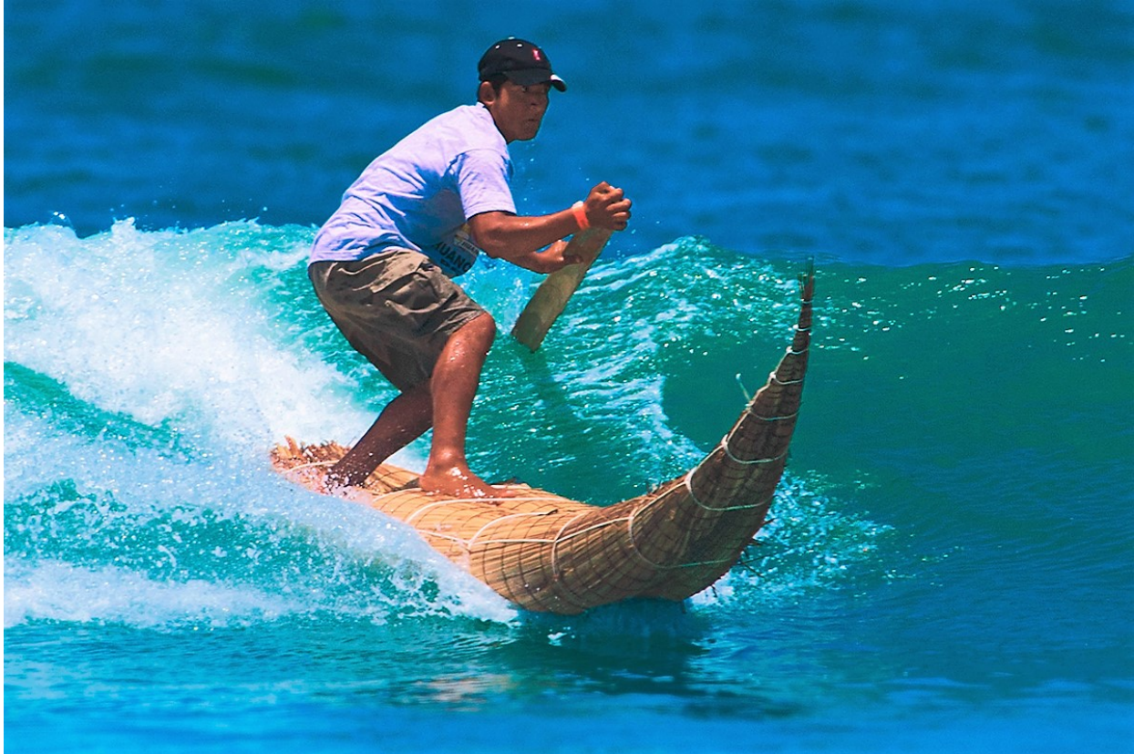
Surfeando en el norte del Peru

Destacados • Caral, patrimonio de la Humanidad UNESCO • Chavin de Guantar • Huaraz • Laguna Llanganuco • Cordillera Blanca • Yungay • Trujillo • Casa Urquiaga-Calonge • Templos Moche • Huanchaco • Chan Chan • Talara • Playas del Norte Peruano • Mancora Playa