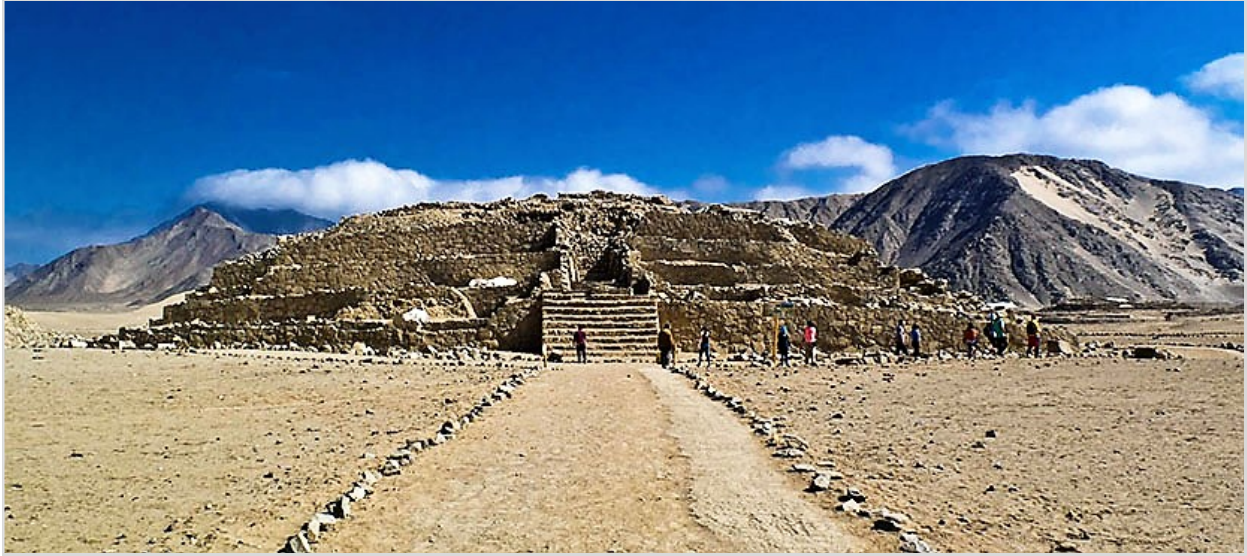
Caral, declarada patrimonio cultural por la UNESCO

Destacados • Caral, patrimonio de la Humanidad UNESCO • Chavin de Huantar • Huaraz • Laguna Llanganuco • Cordillera Blanca • Yungay • Trujillo • Casa Urquiaga-Calonge • Templos Moche • Huanchaco • Chan Chan • Talara • Playas del Norte Peruano • Mancora Playa