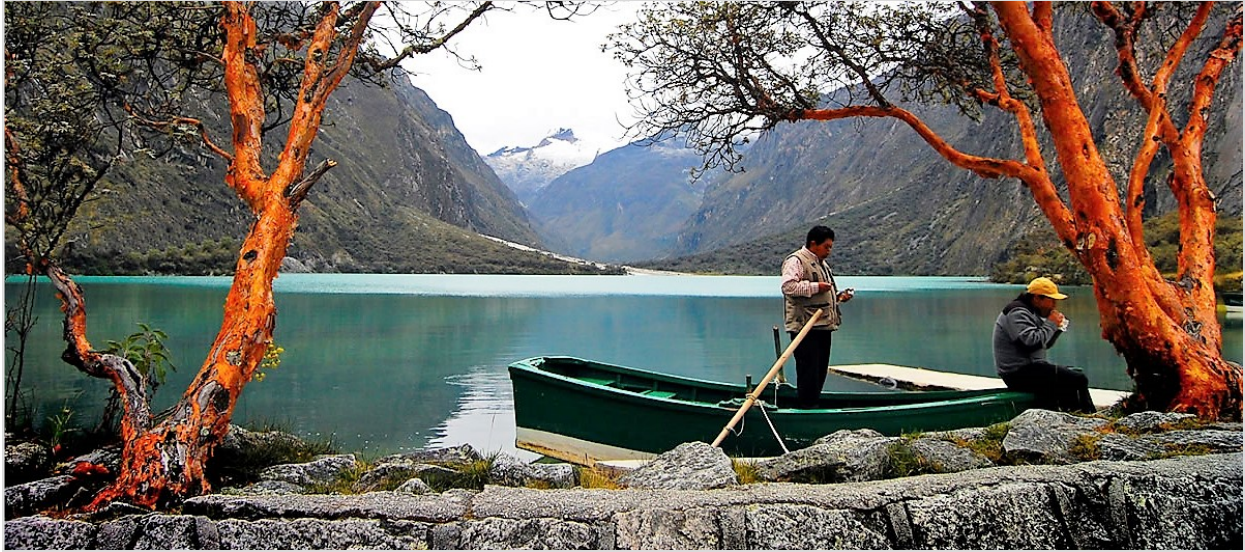
Laguna de Llanganuco.

Destacados • Caral, patrimonio de la Humanidad UNESCO • Chavin de Guantar • Huaraz • Laguna Llanganuco • Cordillera Blanca • Yungay • Trujillo • Casa Urquiaga-Calonge • Templos Moche • Huanchaco • Chan Chan • Talara • Playas del Norte Peruano • Mancora Playa