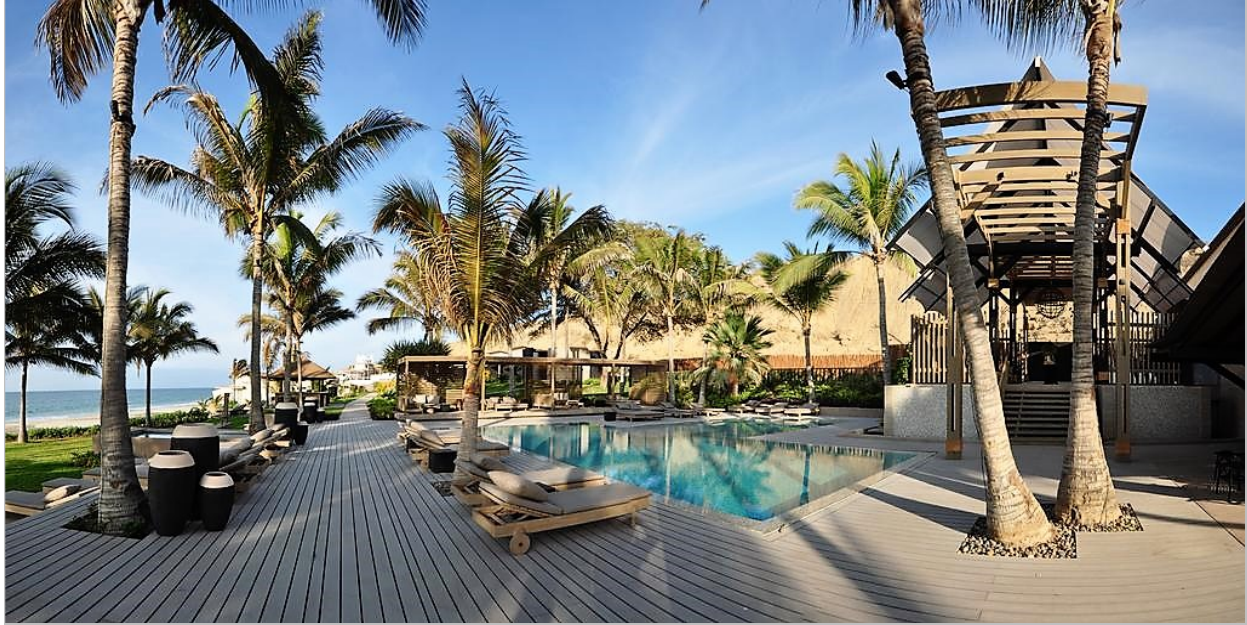
Arennas Mancora Resort

Destacados • Caral, patrimonio de la Humanidad UNESCO • Chavin de Guantar • Huaraz • Laguna Llanganuco • Cordillera Blanca • Yungay • Trujillo • Casa Urquiaga-Calonge • Templos Moche • Huanchaco • Chan Chan • Talara • Playas del Norte Peruano • Mancora Playa