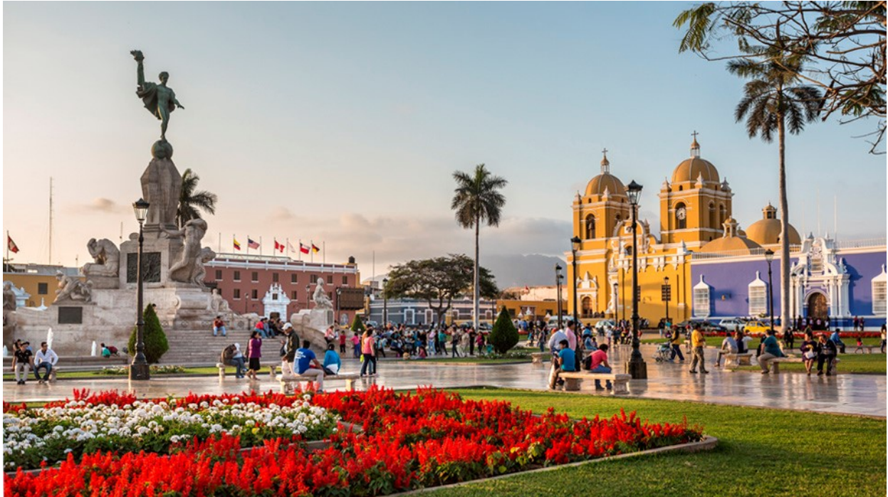
Trujillo, Plaza principal.

Destacados • Caral, patrimonio de la Humanidad UNESCO • Chavin de Guantar • Huaraz • Laguna Llanganuco • Cordillera Blanca • Yungay • Trujillo • Casa Urquiaga-Calonge • Templos Moche • Huanchaco • Chan Chan • Talara • Playas del Norte Peruano • Mancora Playa