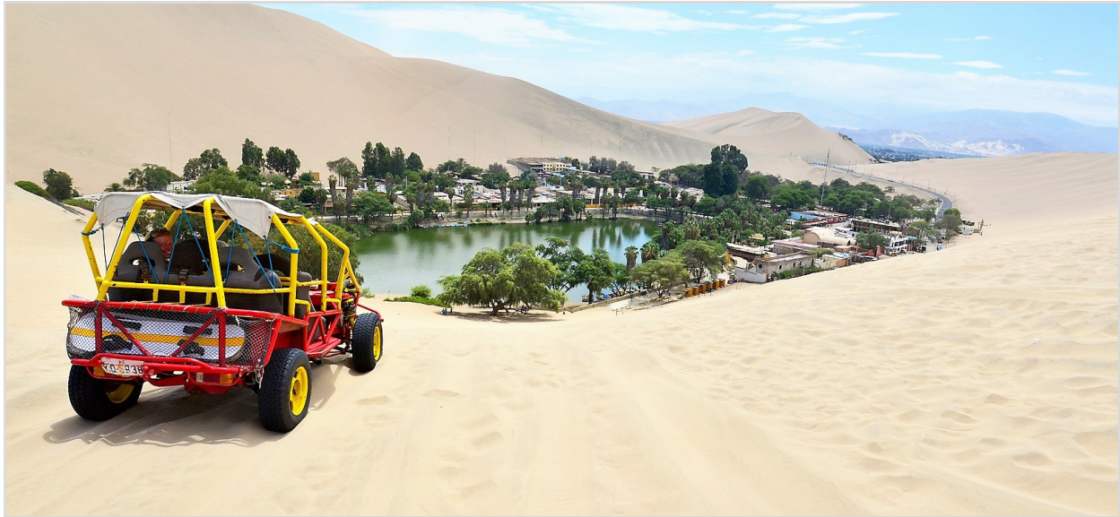
Huacachina Oasis, Ica

Destacados • Lima • Awana Kancha • Pisac Ruins • Urubamba Valley • Aguas Calientes • Machu Picchu • Camino del Inca • Ollantaytambo • Moray • Maras • Saqsawaman • Pukapukara • Qenko • Cusco • La Ruta Del Sol • Puno • Islas Uros • Lake Titicaca • Lagunas Altiplánicas • Volcan Patapampa • Cañon del Colca • Arequipa • Convento Santa Catalina • Paracas • Oasis Huacachina • Líneas de Nasca • Tacama