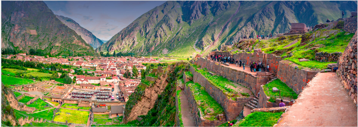
Ruinas de Ollantaytambo, Valle Sagrado de los Incas

Destacados • Lima • Awana Kancha • Pisac Ruins • Urubamba Valley • Aguas Calientes • Machu Picchu • Camino del Inca • Ollantaytambo • Moray • Maras • Saqsawaman • Pukapukara • Qenko • Cusco • La Ruta Del Sol • Puno • Islas Uros • Lake Titicaca • Lagunas Altiplánicas • Volcan Patapampa • Cañon del Colca • Arequipa • Convento Santa Catalina • Paracas • Oasis Huacachina • Líneas de Nasca • Tacama