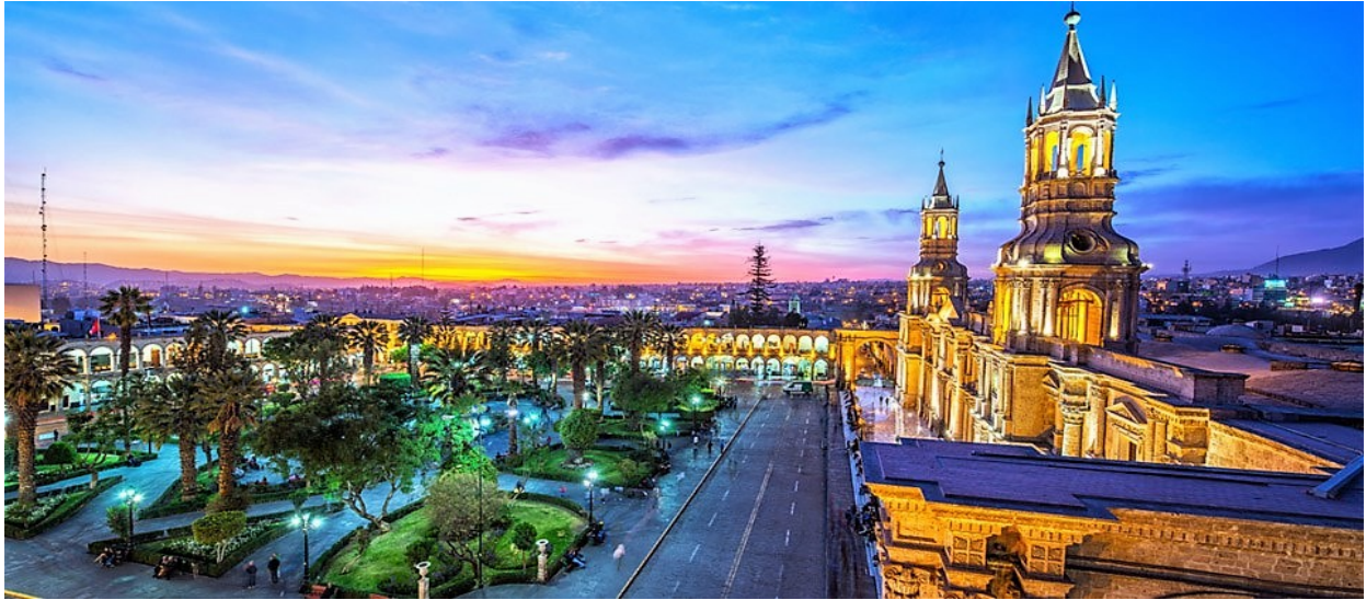
Plaza de Armas, Arequipa

Destacados • Lima • Awana Kancha • Pisac Ruins • Urubamba Valley • Aguas Calientes • Machu Picchu • Camino del Inca • Ollantaytambo • Moray • Maras • Saqsawaman • Pukapukara • Qenko • Cusco • La Ruta Del Sol • Puno • Islas Uros • Lake Titicaca • Lagunas Altiplánicas • Volcan Patapampa • Cañon del Colca • Arequipa • Convento Santa Catalina • Paracas • Oasis Huacachina • Líneas de Nasca • Tacama