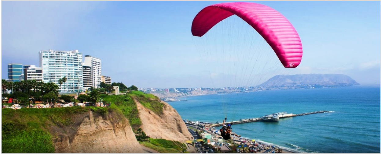
Larcomar Miraflores Lima

Destacados • Lima • Awana Kancha • Pisac Ruins • Urubamba Valley • Aguas Calientes • Machu Picchu • Camino del Inca • Ollantaytambo • Moray • Maras • Saqsawaman • Pukapukara • Qenko • Cusco • La Ruta Del Sol • Puno • Islas Uros • Lake Titicaca • Lagunas Altiplánicas • Volcan Patapampa • Cañon del Colca • Arequipa • Convento Santa Catalina • Paracas • Oasis Huacachina • Líneas de Nasca • Tacama