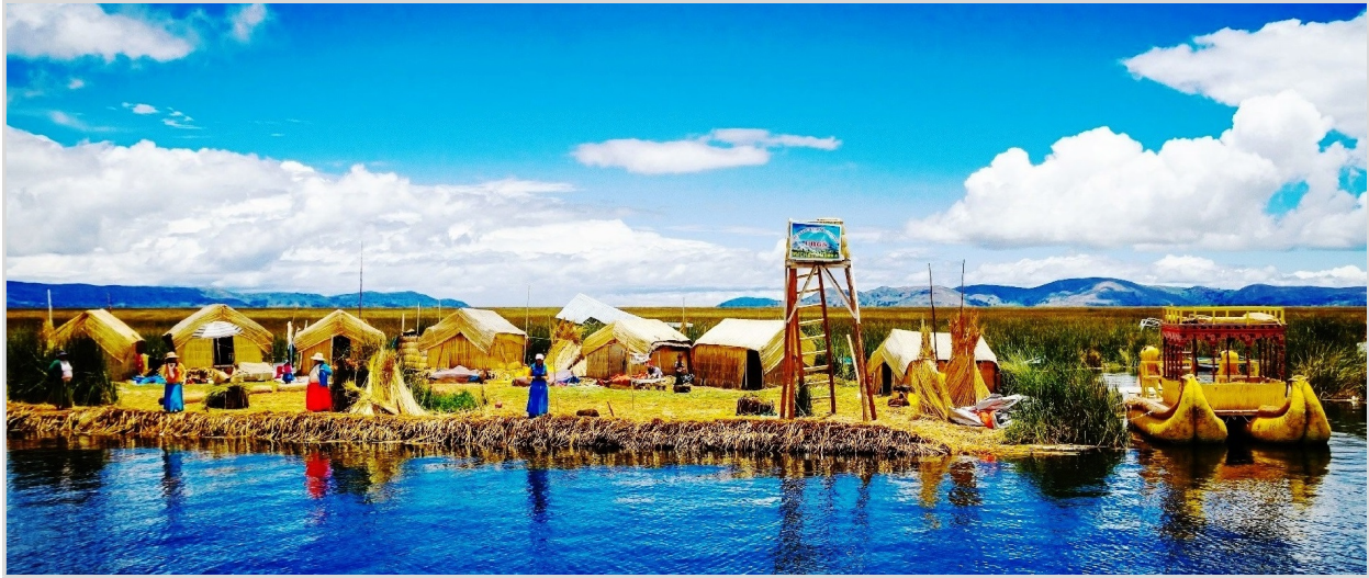
Islas de Uros, Lago Titicaca

Destacados • Lima • Awana Kancha • Pisac Ruins • Urubamba Valley • Aguas Calientes • Machu Picchu • Camino del Inca • Ollantaytambo • Moray • Maras • Saqsawaman • Pukapukara • Qenko • Cusco • La Ruta Del Sol • Puno • Islas Uros • Lake Titicaca • Lagunas Altiplánicas • Volcan Patapampa • Cañon del Colca • Arequipa • Convento Santa Catalina • Paracas • Oasis Huacachina • Líneas de Nasca • Tacama