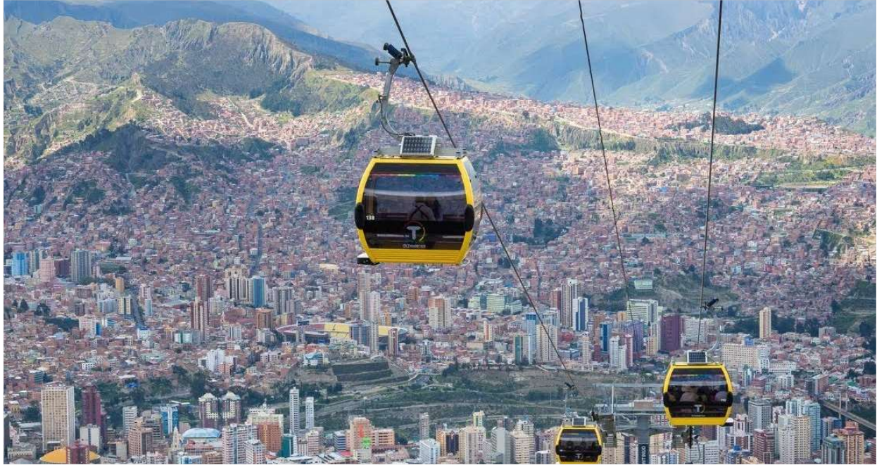
La Paz, Bolivia

Destacados • La Paz • Valle de la Luna • Mercado de Brujas • Copacabana • Isla del Sol • Lago Titicaca • Fuente de la Juventud • Los Yungas • Cochabamba • Tarata • Parque Nacional Torotoro • El Vergal Cataratas • Huellas de Dinosaurios • Umajalanta • Ciudad de Itas • Sucre • Potosí • Salar de Uyuni • Cementerio de Trenes • Colchani • Incahuasi • Volcán Tunupa • Momias • Valle de las Rocas • Lagunillas • Laguna Colorada.