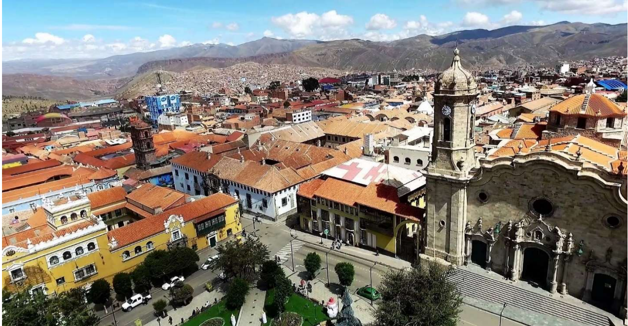
San Luis de Potosí

Destacados • La Paz • Valle de la Luna • Mercado de Brujas • Copacabana • Isla del Sol • Lago Titicaca • Fuente de la Juventud • Los Yungas • Cochabamba • Tarata • Parque Nacional Torotoro • El Vergal Cataratas • Huellas de Dinosaurios • Umajalanta • Ciudad de Itas • Sucre • Potosí • Salar de Uyuni • Cementerio de Trenes • Colchani • Incahuasi • Volcán Tunupa • Momias • Valle de las Rocas • Lagunillas • Laguna Colorada.