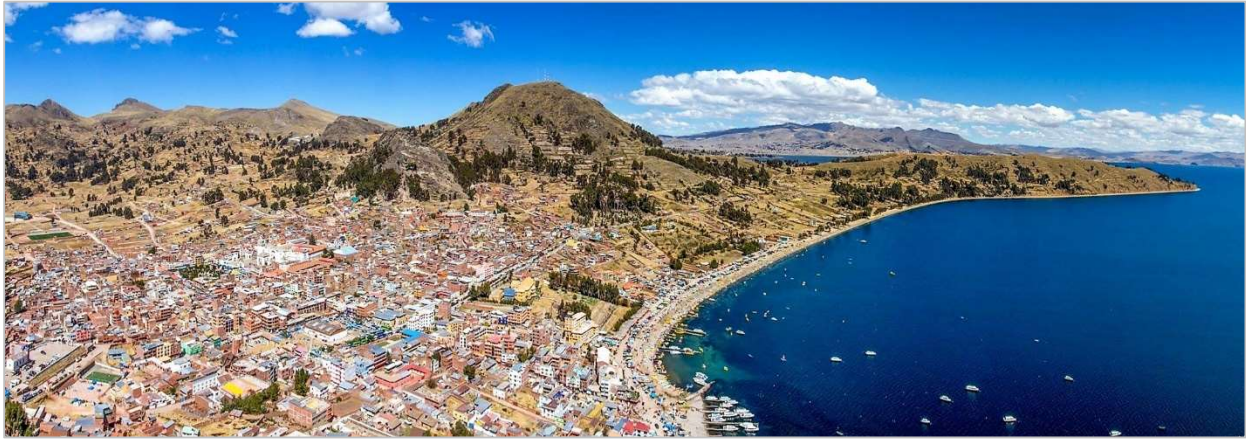
Copacabana, Lago Titicaca Bolivia

Destacados • La Paz • Valle de la Luna • Mercado de Brujas • Copacabana • Isla del Sol • Lago Titicaca • Fuente de la Juventud • Los Yungas • Cochabamba • Tarata • Parque Nacional Torotoro • El Vergal Cataratas • Huellas de Dinosaurios • Umajalanta • Ciudad de Itas • Sucre • Potosí • Salar de Uyuni • Cementerio de Trenes • Colchani • Incahuasi • Volcán Tunupa • Momias • Valle de las Rocas • Lagunillas • Laguna Colorada.