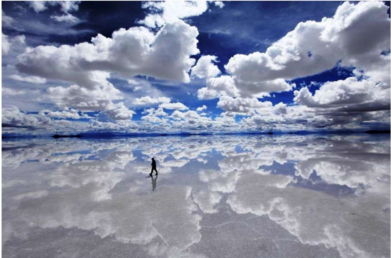
Salar de Uyuni

Destacados • La Paz • Valle de la Luna • Mercado de Brujas • Copacabana • Isla del Sol • Lago Titicaca • Fuente de la Juventud • Los Yungas • Cochabamba • Tarata • Parque Nacional Torotoro • El Vergel Cataratas • Huellas de Dinosaurios • Umajalanta • Ciudad de Itas • Sucre • Potosí • Salar de Uyuni • Cementerio de Trenes • Colchani • Incahuasi • Volcán Tunupa • Momias • Valle de las Rocas • Lagunillas • Laguna Colorada.