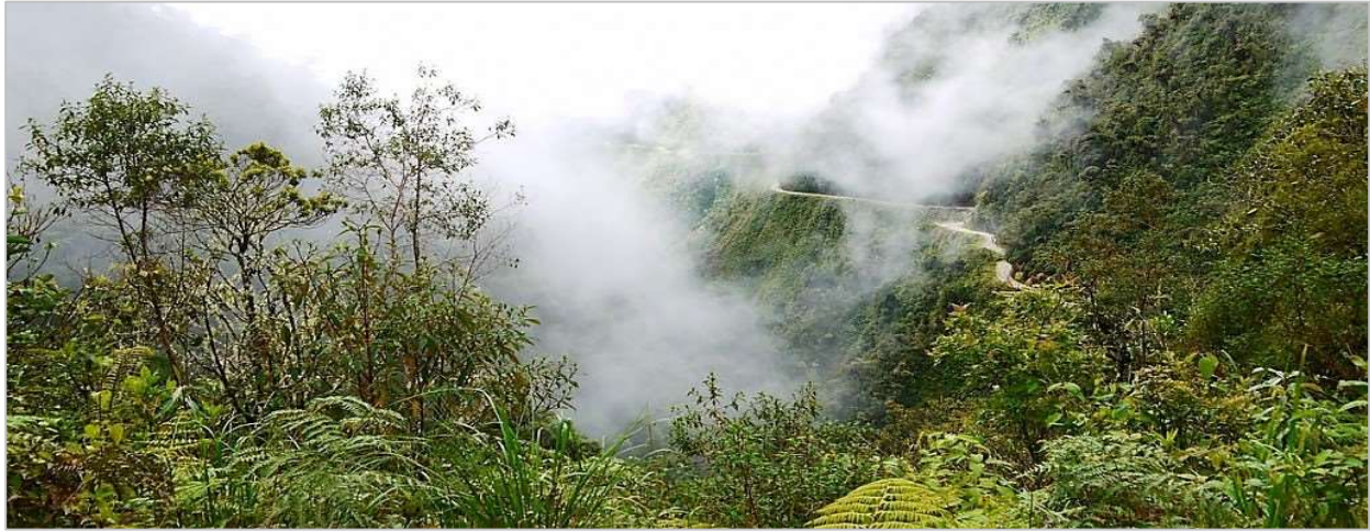
Los Yungas Andes Tempered and Cloud Forest Region

Destacados • La Paz • Valle de la Luna • Mercado de Brujas • Copacabana • Isla del Sol • Lago Titicaca • Fuente de la Juventud • Los Yungas • Cochabamba • Tarata • Parque Nacional Torotoro • El Vergal Cataratas • Huellas de Dinosaurios • Umajalanta • Ciudad de Itas • Sucre • Potosí • Salar de Uyuni • Cementerio de Trenes • Colchani • Incahuasi • Volcán Tunupa • Momias • Valle de las Rocas • Lagunillas • Laguna Colorada.